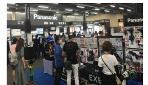
2022年グランドフェアの様子